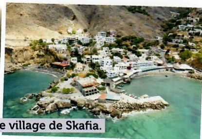
Le village de Sfakia.

Rethymnon ► Alikambos ► Agia Roumeli ► Sfakia ► Église Saint-Paul ► Comitades ► Rethymnon