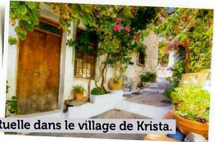
Ruelle dans le village de Krista.

Messe avec une communauté paroissiale d'Héraklion.