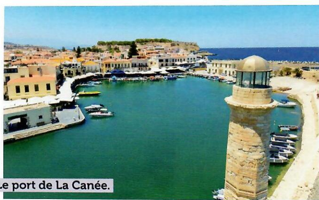
Le port de La Canée.

Kastelli et ses vestiges vénitiens, le bastion Schiavo et sa vue sur la ville, le marché. Départ pour la visite du monastère Aghia Triada à Akrotiri. Le monastère de la Sainte-Trinité, datant du XVI e siècle, fut l'un des premiers monastères de la presqu'île d'Akrotiri. Il domine toute la plaine de la presqu'île et offre une vue grandiose.